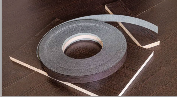
PVC EDGE BANDING احزمة تقشيط