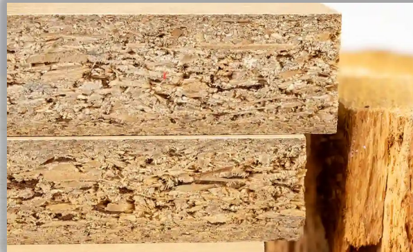
CORE CHIPBOARD الواح الشيببورد