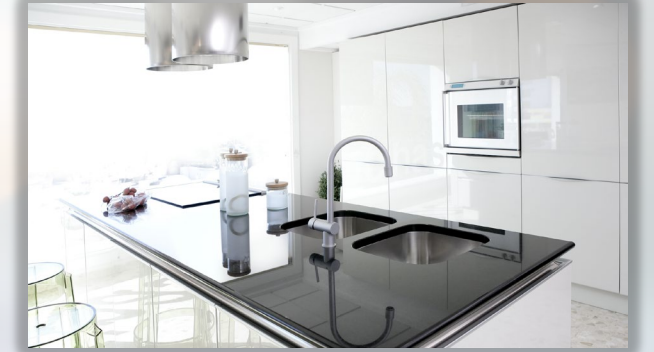
EB & NANOTECHNOLOGY SURFACES تقنية النانو وشعاع الإلكترونات