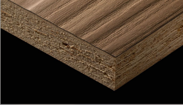
MFC [MELAMINE FACED CHIPBOARDS] شيببورد الميلامين

تقدم شركة WPC مجموعة واسعة من الأخشاب المعالجة عالية الجودة المستوردة من إيطاليا وتركيا وألمانيا ومنتجات بتقنيه عالية من الصين. بعض المنتجات المتوفرة هي: