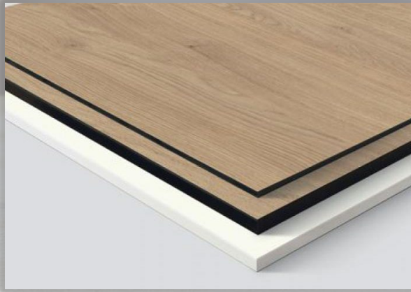
CPL AND COMPACT LAMINATES اللامينيت