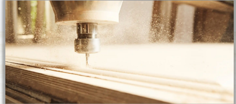
WOOD WORKING خدمات صناعية